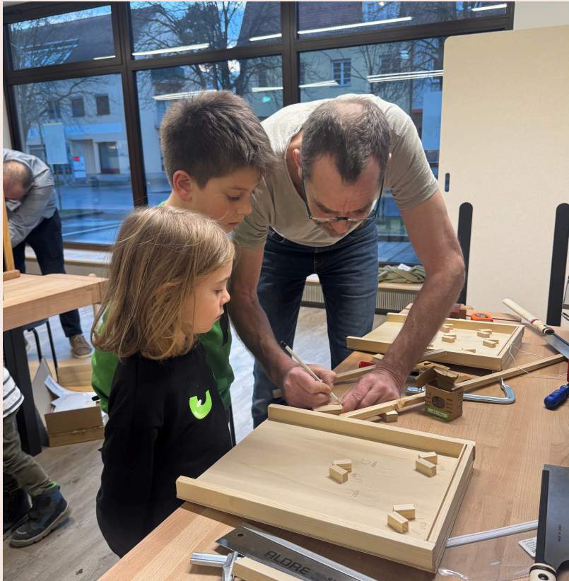
Kinder lernen in einem betreuten und sicheren Umfeld den Umgang mit unterschiedlichen Werkzeugen.