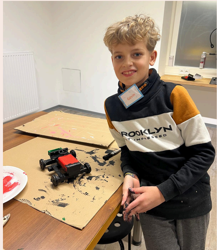
Technik für Kinder weckt die Begeisterung für das Handwerk.