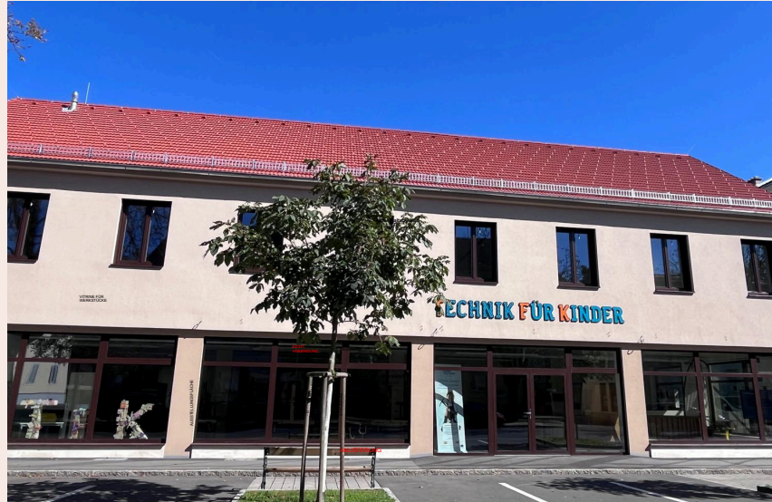
Die Werkstätte von Technik für Kinder im Steirischen Vulkanland.